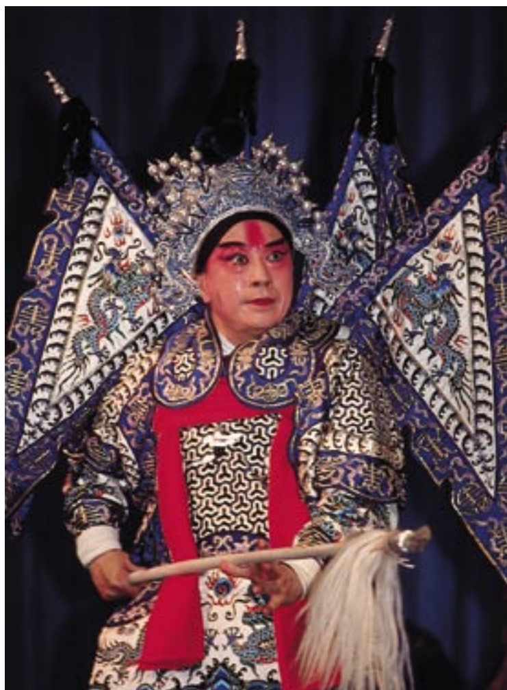
Spectacle type « Opéra de Pékin »

formalités et météo de vos vacances, voir pages 256 et 257.