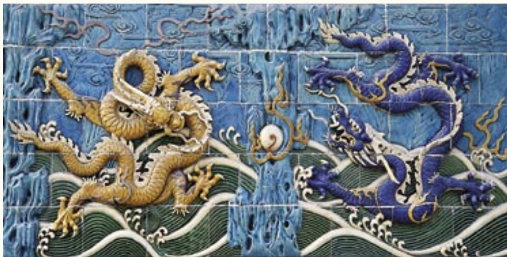
Beijing, le mur des 9 Dragons dans la Cité Interdite

Tour de la vieille ville et du jardin du Mandarin Yu. Découverte du temple du Bouddha de Jade, lieu de culte toujours fréquenté. Déjeuner. L'après-midi, promenade rue de Nankin, la principale artère commerçante de Shanghai. Dîner en ville. Spectacle d'acrobaties. Nuit à l'hôtel.