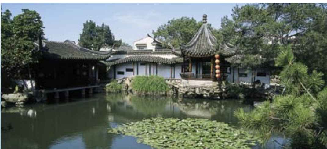
Suzhou, le jardin du Maître des Filets

De Beijing à Guangzhou, un itinéraire complet qui combine les sites incontournables à une découverte approfondie de la Chine.